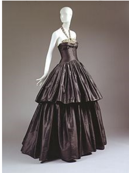
Robe de soirée « Cyclone » créée par Jeanne Lanvin, 1939