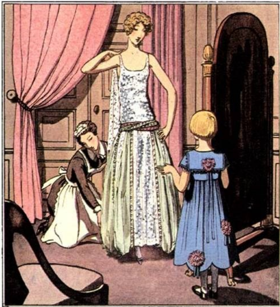
Deux modèles de Jeanne Lanvin, dessin de Pierre Brissaud ( Gazette du bon ton , 1922).

Le talent de cette grande couturière est tel qu'une collection pour femmes en lancée en 1909. Ses robes sont réputées et la finition de ses toilettes lui confère une grande renommée.