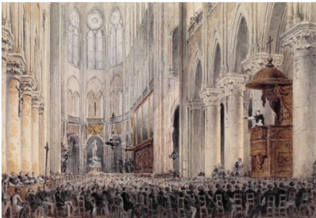
Conférence de Lacordaire à Notre-Dame de Paris, vers 1845, dessin anonyme, Bibliothèque nationale de France

Henri Lacordaire ; Conférence de Notre-Dame de Paris, (1851)