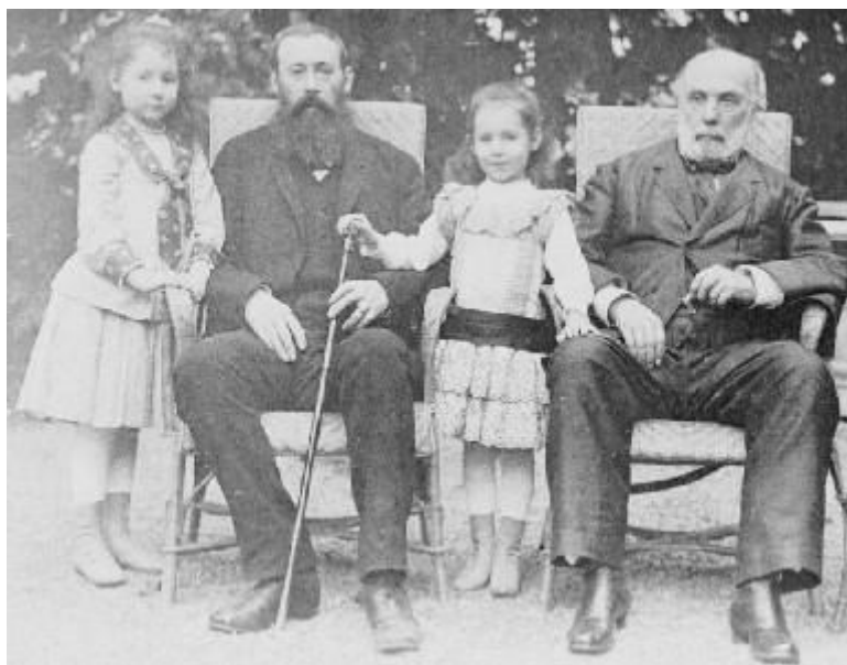
Daniel Wilson, deux de ses filles et Jules Grévy (à droite) en 1889

Décédée le 1 er mars 1893 à Mont-sous-Vaudray Jura 39