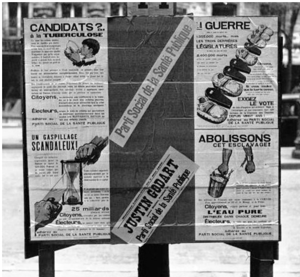
Affiches électorales en 1932