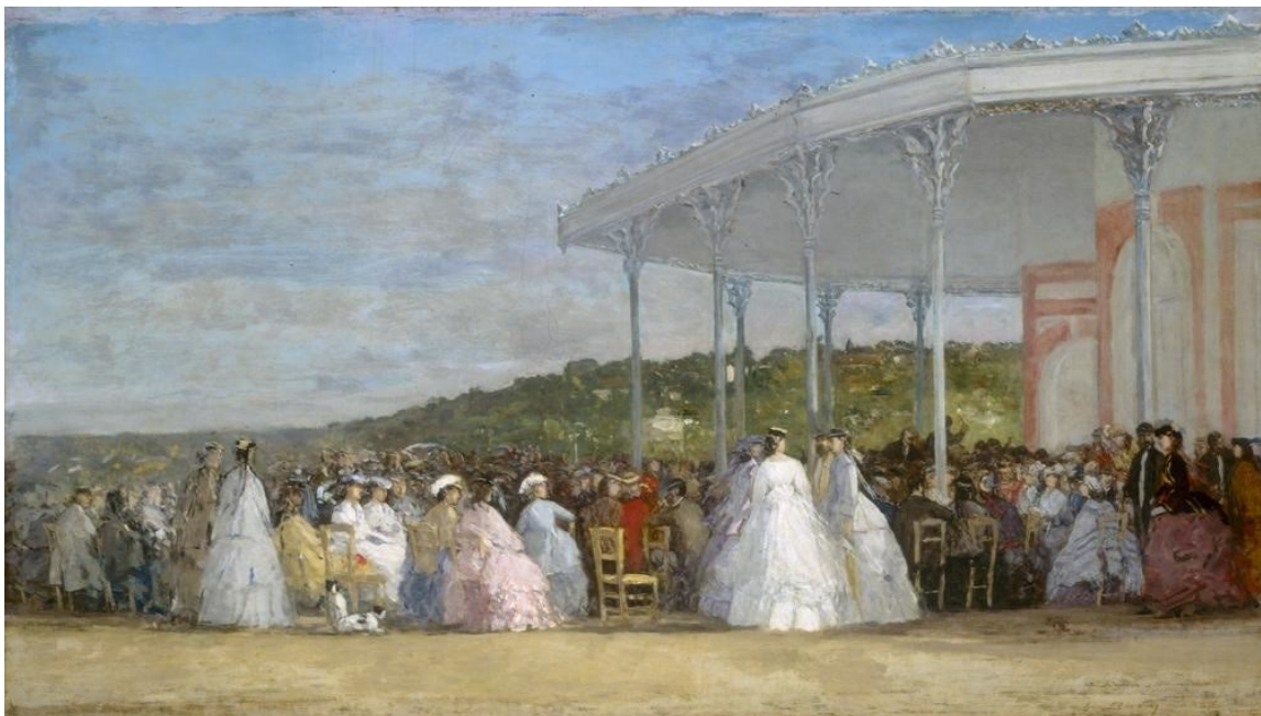
Casino de Deauville - Geobunnik - Overblog

C'est ainsi que naît le casino de Deauville fleuron du succès de la station normande.