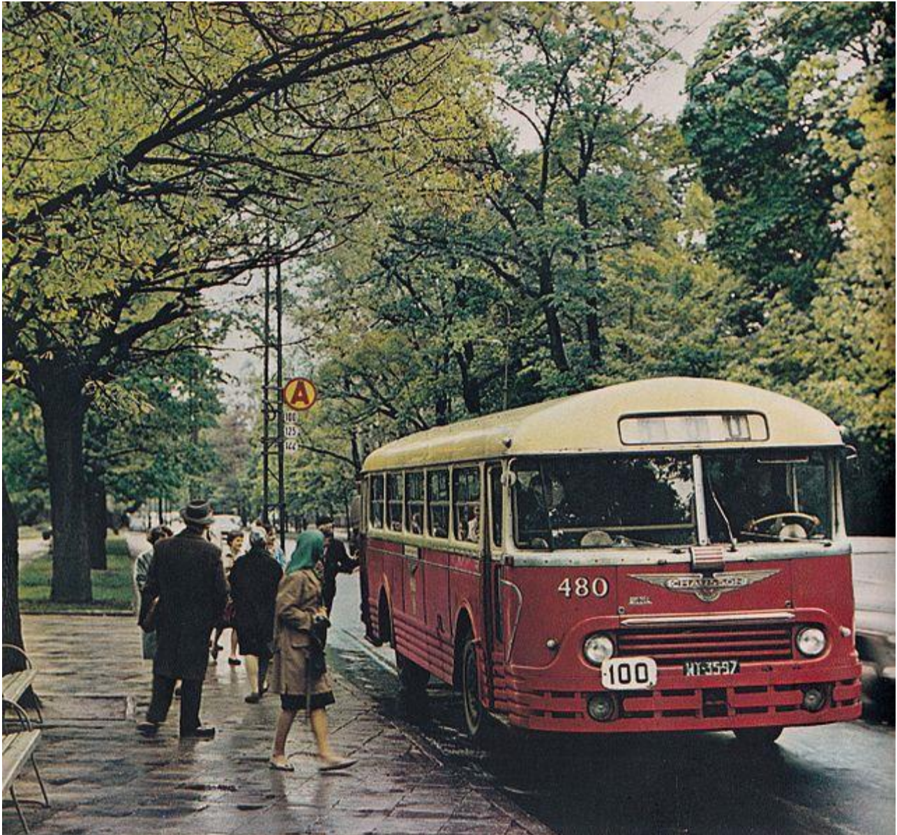
Car Chausson années 1960

Du radiateur à la carrosserie, il n'y a qu'un pas vite franchi par la SUC qui se met, dès 1934, à fabriquer en série carrosseries pour véhicules légers et cabines de poids lourds.