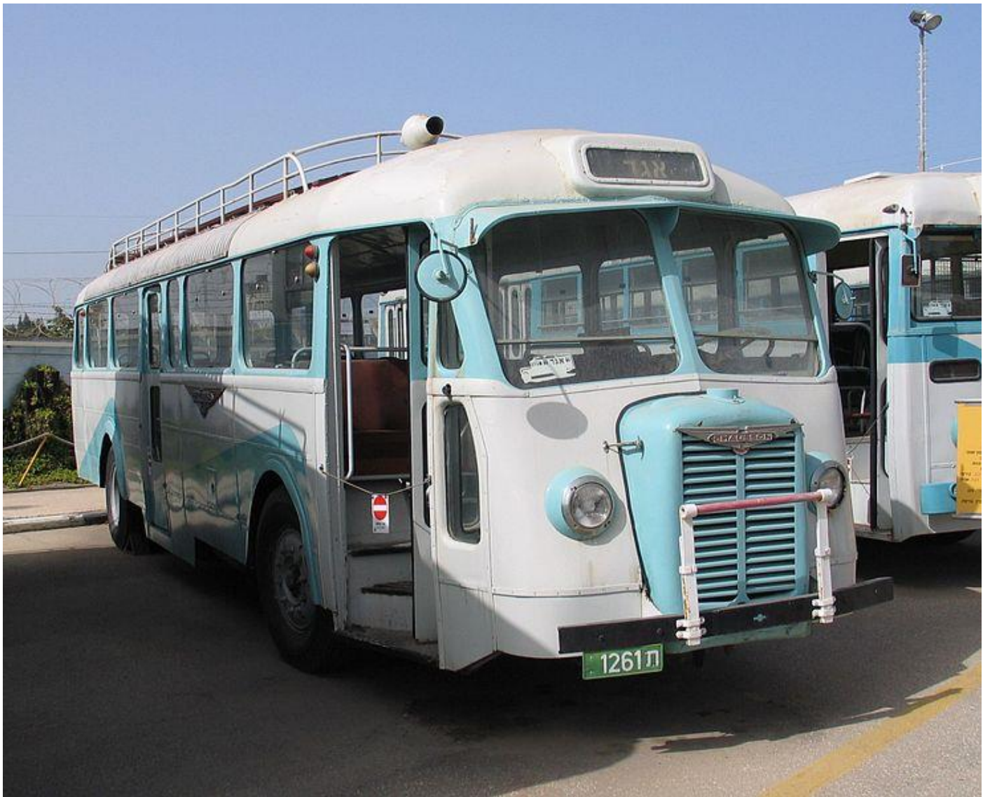
Autobus Chausson – 1949