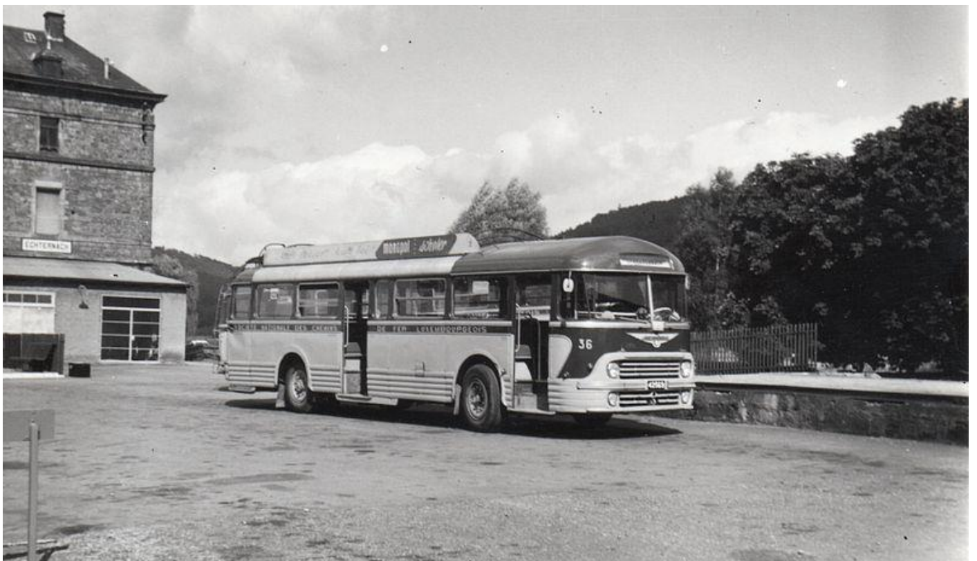
Autobus Chausson-Saviem en 1973.