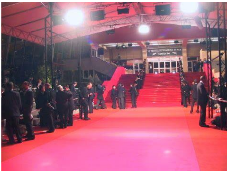
Les marches du Palais du Festival de Cannes

Pour l'un de ses reportages pour l'émission Panorama , en janvier 1968, pendant la guerre du Viêt Nam, pour l'ORTF il interviewe un pilote américain détenu dans une prison du Nord-Viêt Nam qui n'est autre que John McCain, futur sénateur et candidat républicain à l'élection présidentielle de 2008 aux États-Unis.