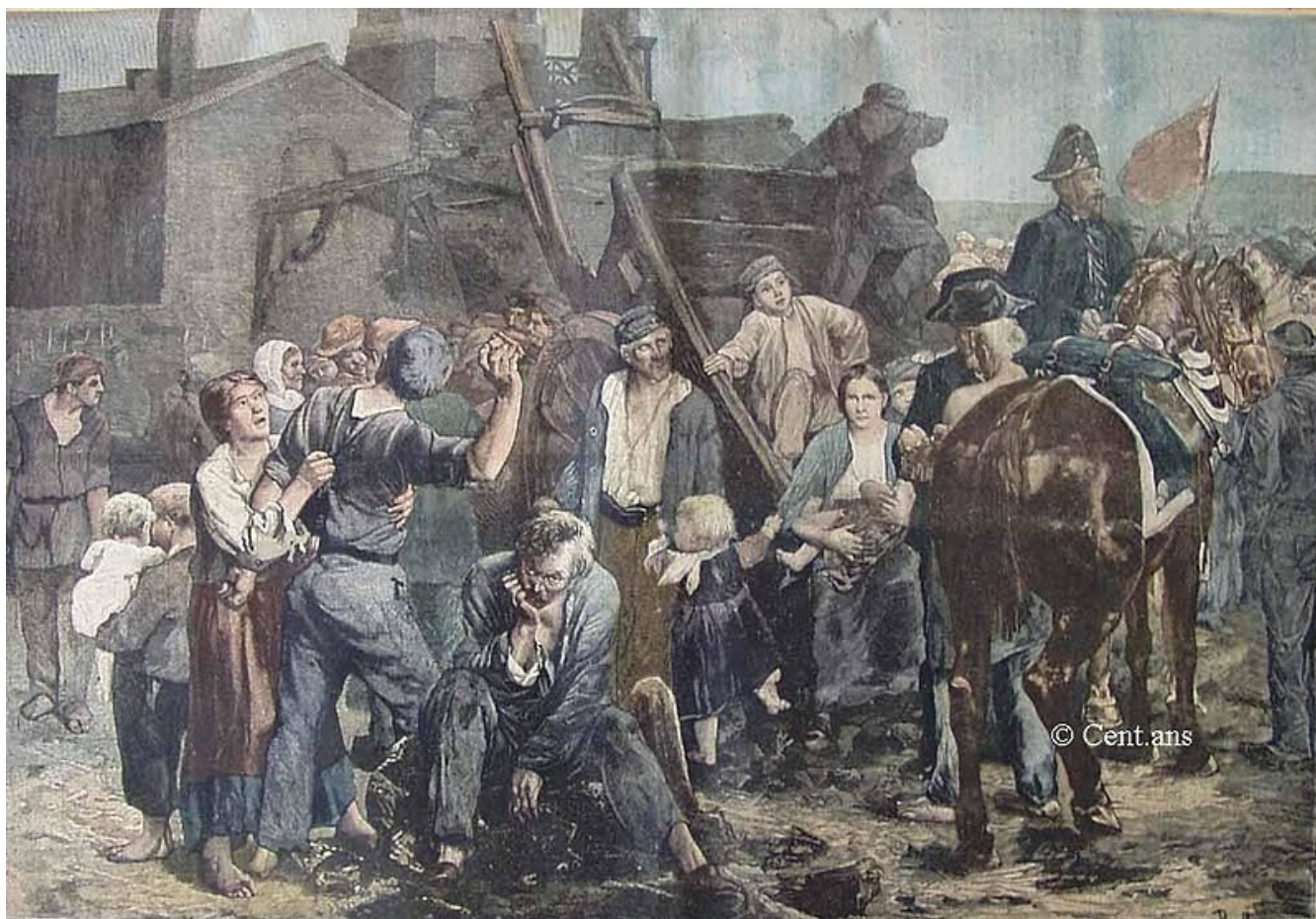
LA GRÈVE DES MINEURS (Tableau de Itoll)

Calvignac reste premier magistrat de la ville de Carmaux pendant plus de trente ans jusqu'à l'âge de 75 ans.