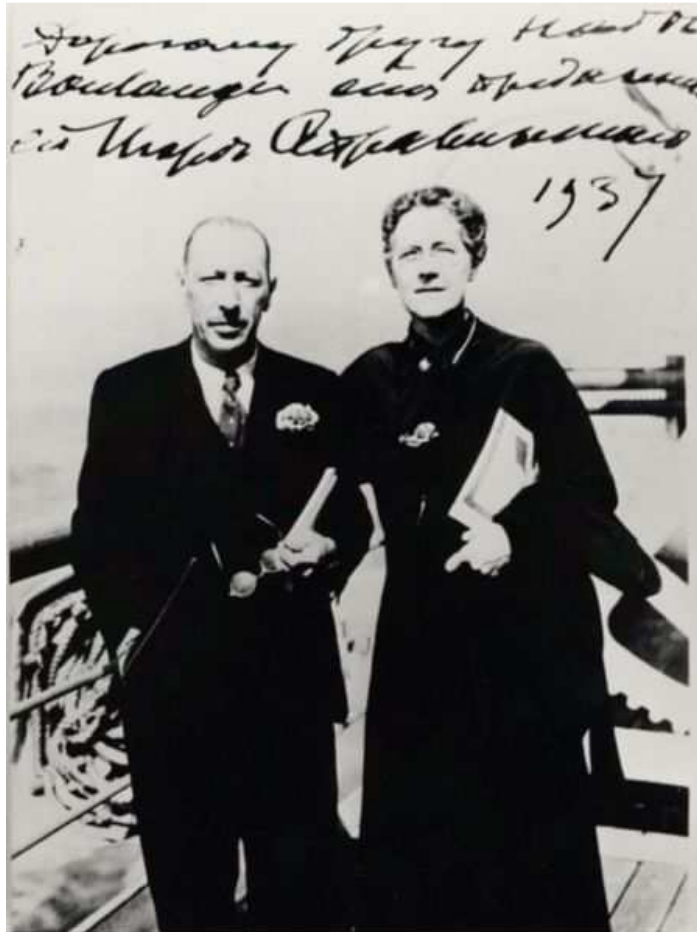
Igor Stravinsky et Nadia Boulanger sur un paquebot transatlantique en 1937

Elle sait être l'artisan minutieux qui se dévoue au service de ses élèves, pour les amener à sortir le meilleur d'eux-mêmes, sachant qu'elle conjugue toujours l'art musical au « plus-que-parfait ».