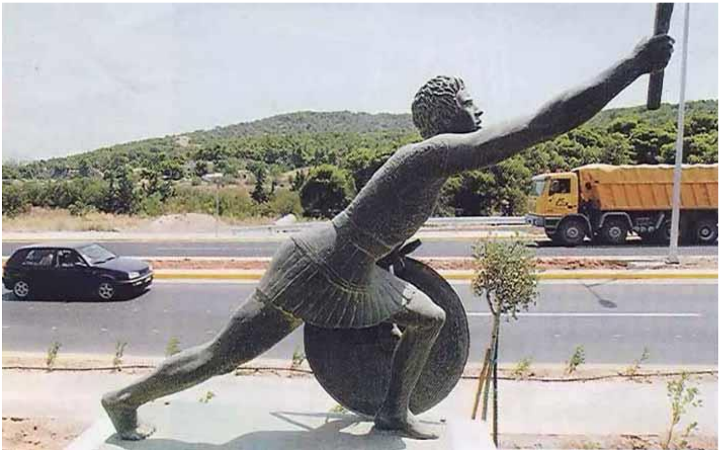
Statue de Philippidès à Marathon

(*) Le marathon créé lors des J.O. d'Athènes de 1896 pour commémorer la légende du messager grec Philippidès qui aurait parcouru la distance de Marathon à Athènes pour annoncer la victoire contre les Perses en 490 av. J.C., il est couru jusqu'en 1921, sur une distance d'environ 40km avant que l'Association Internationale des Fédérations d'Athlétisme n'en fixe la distance officielle à 42,195 km.