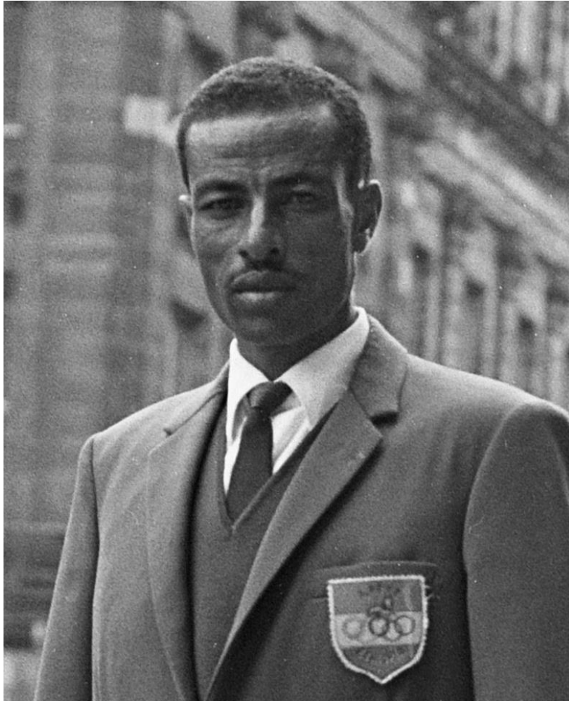
Abébé Bikila en 1968

Décédé le 25 octobre 1973 à Addis-Abéba Éthiopie