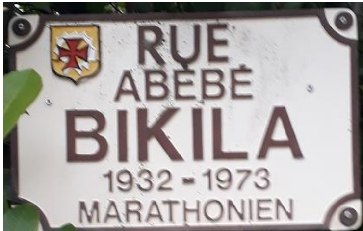
Plaque de rue de St-Jean (Hte-Garonne).