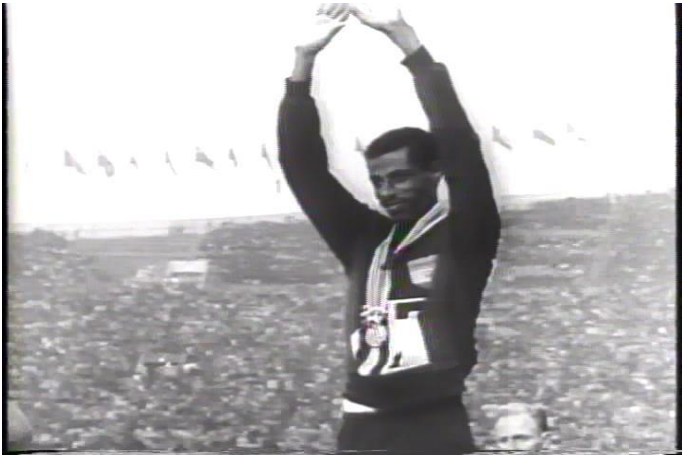
Abébé Bikila aux JO de Tokyo le 21 octobre 1964.