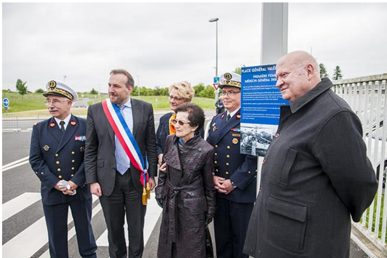
Inauguration de la place Valérie André à Brétigny-sur-Orge.

Elle est la 3 e femme à recevoir la Grand-croix de l'Ordre national de la Légion d'honneur après Geneviève de Gaulle-Anthonioz et Germaine Tillion .