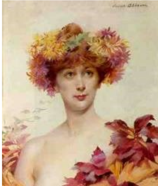
Portrait de Sarah Bernhardt par Louise Abbéma

Est-ce inspirée par l'art de la fabulation chère à Sarah Bernhardt que, Louise fait longtemps croire qu'elle est née cinq ans plus tard en 1858 ?