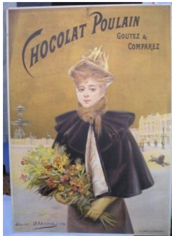
Affiche publicitaire réalisée par Louise Abbéma